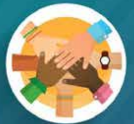
ร่วมกันแก้ปัญหา