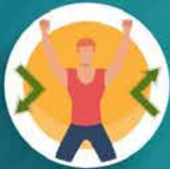
มีภูมิคุ้มกัน