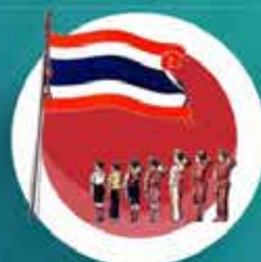
มีสำนึกรักชาติ รักถิ่น