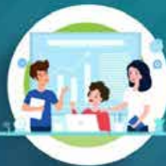
รวมกลุ่มสร้างรายได้