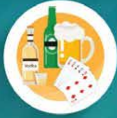
ลดละเลิกอบายมุข