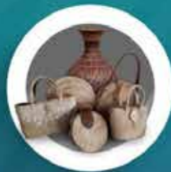
พัฒนาต่อยอดผลิตภัณฑ์ ทางวัฒนธรรม CPOT