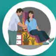
เอื้อเพื่อเกื้อกูล