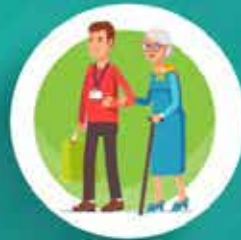
มีน้ำใจไมตรี