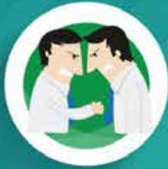
ไม่มีการทะเลาะวิวาท