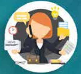
พึ่งพาตนเอง