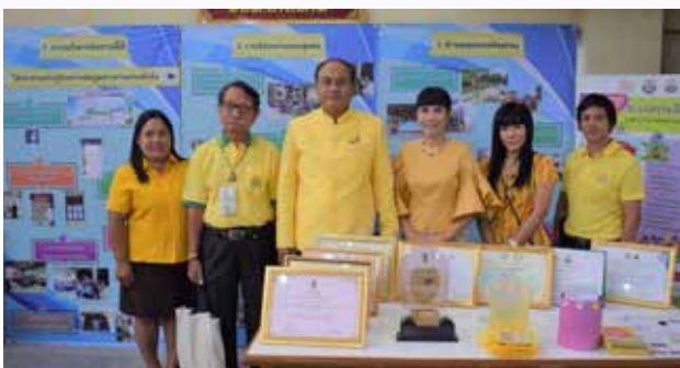
๗๒ การส่งเสริมคุณธรรมแห่งชาติ ประจำปี ๒๕๖๒

ปีงบประมาณ ๒๕๖๒ จังหวัดเพชรบุรี แก่นำชุมชนคุณธรรมในจังหวัดเพชรบุรี ทั้ง ๓ ระดับ ๕๐๕ ชุมชน เพื่อสร้างความรู้ความเข้าใจ ในการส่งเสริมและพัฒนาชุมชนให้เป็นมาตรฐานเดียวกัน เป็นฐานในการขับเคลื่อนจังหวัดคุณธรรม และการประกาศเจตนารมณ์ขับเคลื่อนจังหวัดคุณธรรม (๒) โครงการส่งเสริมและพัฒนาตามชุมชน กิจกรรมลงพื้นที่ ชุมชนคุณธรรมเพื่อพบปะพูดคุย แสวงหา ประชาคมร่วมกับ ผู้นำและประชาชนในชุมชน สร้างการรับรู้และความร่วมมือ นำสู่สังคม อยู่ดี มีสุข และยกระดับชุมชนในพื้นที่ ๘ อำเภอ ในจังหวัดเพชรบุรี เป็นชุมชนคุณธรรม จำนวน ๑๒๙ ชุมชน (๓) โครงการ ๑๐ ตำบลสร้างชาติ โดยจังหวัดเพชรบุรี ร่วมกับสถาบันราชภัฏเพชรบุรี ในการเสริมสร้างค่านิยม และภูมิคุ้มกันทางสังคม ตามหลักปรัชญาของเศรษฐกิจพอเพียง (๔) โครงการจิตอาสาการรักษาความสะอาดพื้นที่อุทยานเฉลิมพระเกียรติพระบาทสมเด็จพระจอมเกล้าเจ้าอยู่หัว พระนครคีรี โดยจังหวัดเพชรบุรี ร่วมกับ มณฑลทหารบกที่ ๑๕ และส่วนราชการต่างๆ จัดกิจกรรมจิตอาสา รักษาความสะอาดพื้นที่อุทยานเฉลิมพระเกียรติพระบาทสมเด็จพระจอมเกล้าเจ้าอยู่หัว พระนครคีรี ในทุกวันศุกร์ของสัปดาห์