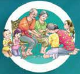
ปฏิบัติดี

สร้างคนดี สังคมดี ชุมชนคุณธรรมเทิดทูนสถาบันชาติ ศาสนา พระมหากษัตริย์