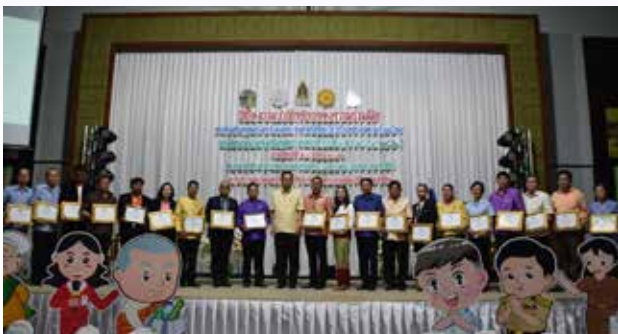
๗๐ การส่งเสริมคุณธรรมแห่งชาติ ประจำปี ๒๕๖๒

กิจกรรมเด่นที่ดำเนินการโดยทุกภาคส่วนในจังหวัดมีส่วนร่วม ได้แก่ (๑) การขับเคลื่อนคุณธรรมระดับองค์กร โดยการจัดพิธีลงนามบันทึกข้อตกลงความร่วมมือการขับเคลื่อนคุณธรรมจังหวัดพิจิตร มีองค์กรเข้าร่วมลงนาม ๑๓๖ องค์กร (๒) การขับเคลื่อนคุณธรรมชุมชนคุณธรรม ด้วยการลงพื้นที่เพื่อสร้างความรู้ความเข้าใจการขับเคลื่อนชุมชนคุณธรรมเพื่อส่งเสริมและพัฒนาชุมชนคุณธรรมสู่ความเป็นชุมชนคุณธรรมต้นแบบ การส่งเสริมกิจกรรมการคัดเลือก ๑๐ สุดยอดชุมชนคุณธรรม และการแลกเปลี่ยนเรียนรู้การดำเนินงานชุมชนคุณธรรม (๓) การขับเคลื่อนอำเภอคุณธรรม ด้วยการจัดประชุมคณะทำงานเครือข่ายอำเภอคุณธรรม เพื่อสร้างความรู้ความเข้าใจการขับเคลื่อนอำเภอคุณธรรมแก่คณะทำงานเครือข่ายคณะทำงานอำเภอคุณธรรม การยกย่องเชิดชูเกียรติบุคคลคุณธรรมต้นแบบของอำเภอ ในวันประชุมคณะกรรมการจังหวัดและหัวหน้าส่วนราชการประจำเดือน (๔) การขับเคลื่อนจังหวัดคุณธรรมโดยประชุมคณะอนุกรรมการส่งเสริมคุณธรรมจังหวัดและคณะทำงานขับเคลื่อนคุณธรรมจังหวัด รวม ๘ ครั้ง