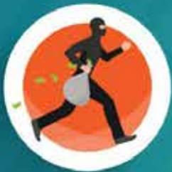
อาชญากรรมหมดไป