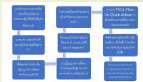
ภาพ : กระบวนการขับเคลื่อนแผนแม่บทส่งเสริมคุณธรรมแห่งชาติ ฉบับที่ ๑ (พ.ศ.๒๕๕๙ - ๒๕๖๔)

จริยธรรมข้าราชการรัฐสภา และสร้างขวัญกำลังใจสำหรับบุคลากรที่ยึดมั่นและปฏิบัติตามหลักคุณธรรมและจริยธรรม โดยคัดเลือกและยกย่องเชิดชูให้เป็นที่ยอมรับ เพื่อให้เกิดต้นแบบ หรือแบบอย่างในการปฏิบัติและยึดมั่นในหลักคุณธรรมและจริยธรรม ซึ่งสำนักงานได้วางรากฐานการปฏิบัติงานด้วยหลักคุณธรรมและจริยธรรมทั้งในระดับบุคคลและหน่วยงานในสังกัด โดยส่งเสริมสนับสนุนให้หน่วยงานในสังกัดตระหนักและสร้างเสริมให้บุคลากรทุกระดับปฏิบัติตามหลักคุณธรรมและจริยธรรม รวมทั้งปณิธานความดี และวัฒนธรรมองค์กรอย่างต่อเนื่อง อันประกอบด้วยกระบวนการขับเคลื่อนแผนแม่บทดังนี้