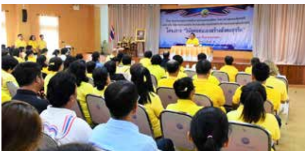
๑๐๖ การส่งเสริมคุณธรรมแห่งชาติ ประจำปี ๒๕๖๒