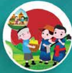
รู้พอเพียง