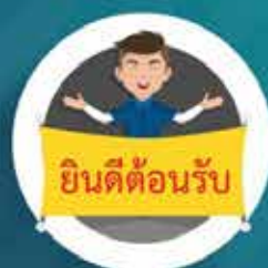
เป็นเจ้าของที่ดี