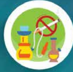
ไม่มียาเสพติด